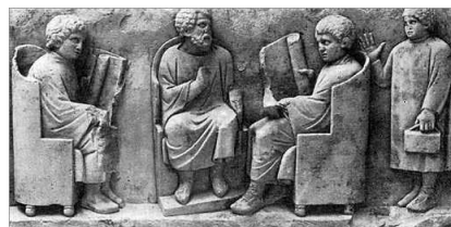
Römische Schule (Relief aus in Trier)

4. Met und Hühnchen liebt ein Römer sehr, Wagenrennen und noch vieles and're mehr; wir wollen ganz viel lachen, im Kolosseum Blödsinn machen, von den sieben Hügeln kommen wir.